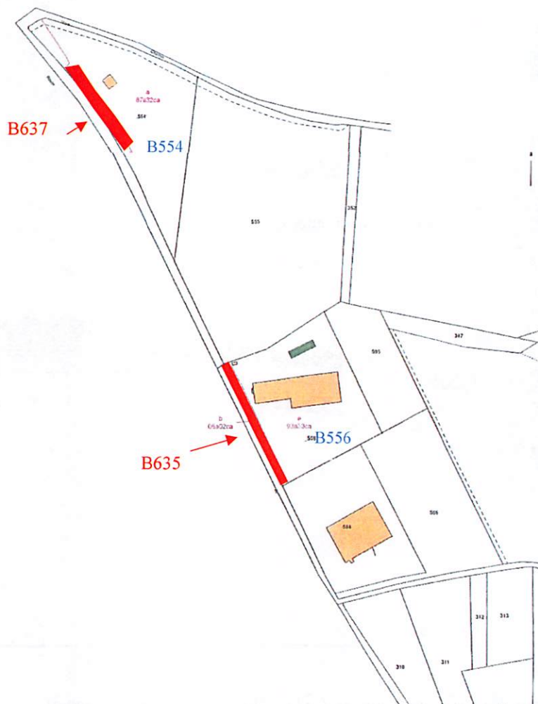
Parcelles B637 et B635 vendues au CD31 (Réservoir semi-enterré et siège)

Le service foncier propose l'acquisition des parcelles en zone Agricole (parcelle B 554) au prix de 1 €/m 2 et les parcelles en zone UE (parcelle B 556) au prix de 8 €/m 2 .